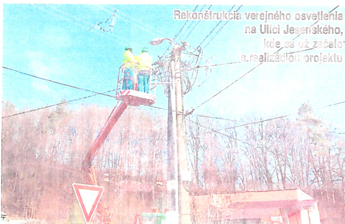
Rekonštrukcia verejného osvetlenia na Ulici Jeseníského, kde sa už začalo s realizáciou projektu