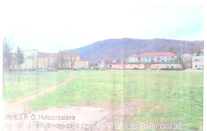
Pri ZŠ P. O. Hviezdoslava by mal vzniknúť nový centrálny klimatický park, tzv. brownfield

Mesto Snina spúšťa veľký projekt adaptácie na zmenu klímy. Podpisáním a zverejnením projektového zmluvy s Ministerstvom životného prostredia Slovenskej republiky. Mesto Snina pristúpilo k spusteniu aktivít pre realizáciu projektu "Snina - mesto pripravené na zmenu podnebia"