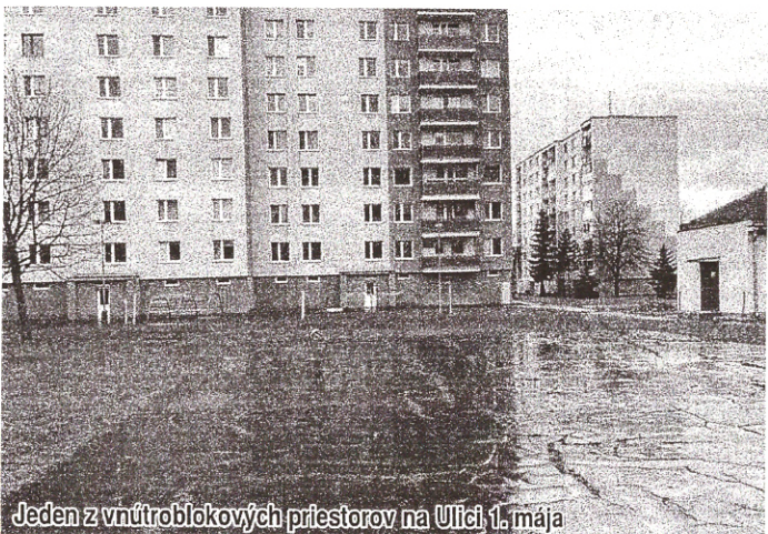
Jeden z vnútroblokových priestorov na Ulici 1. mája