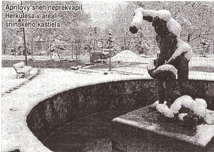
Aprílový sneh neprekvapil Herkúlesa v areáli sninského kaštiela