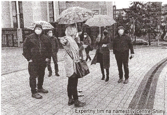
Expertný tím na námestí v centre Sniny

Všetkým lekárom a zdravotníkom patrí veľká vďaka za starostlivosť o pacientov v aktuálne veľmi náročných časoch. (msú)