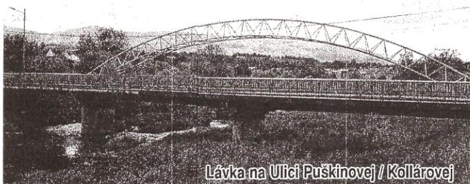
Lávka na Ulici Puškinovej / Kollárovej